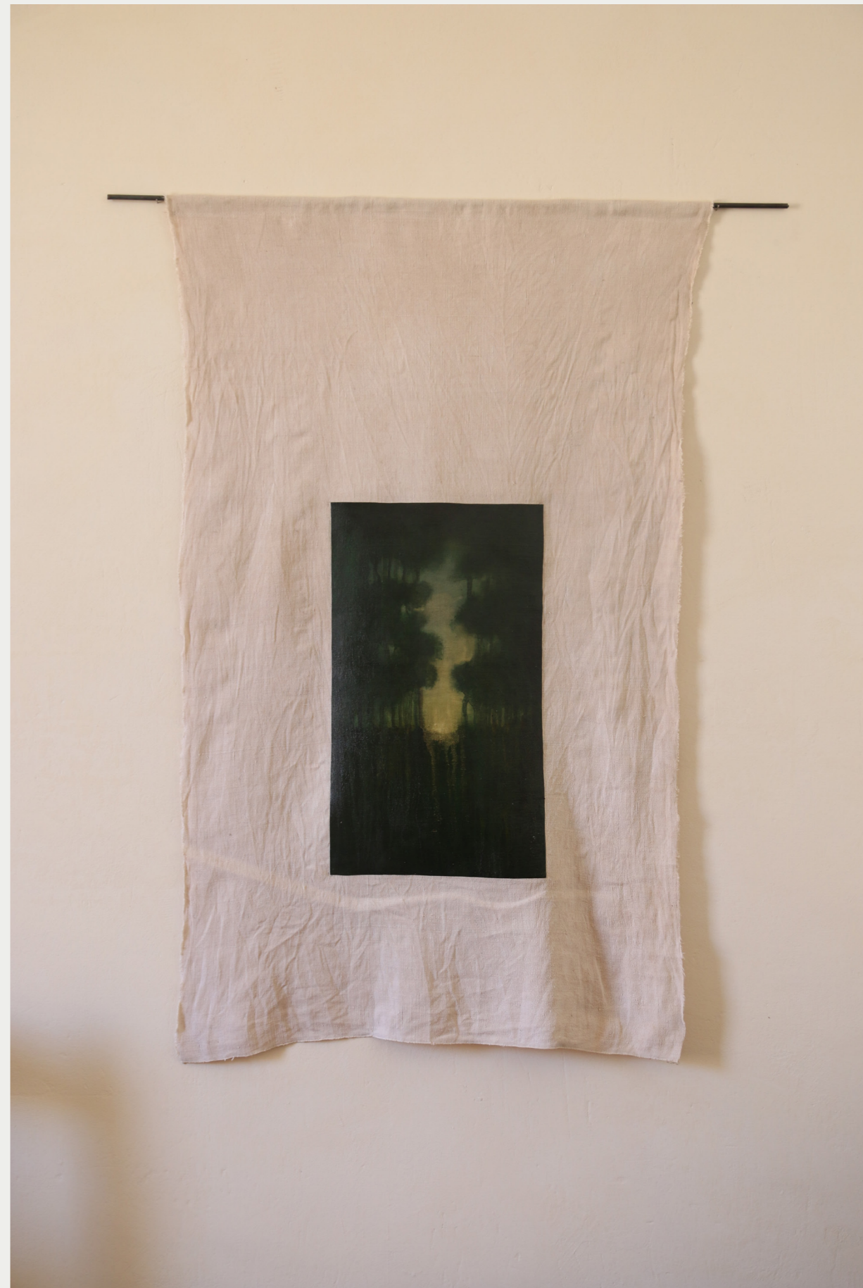
3. PAYSAGE VERT 2022 peinture à l'huile sur toile de lin, marouflage sur toile de lin teintée au thé, baguette en acier 100 x 80 cm