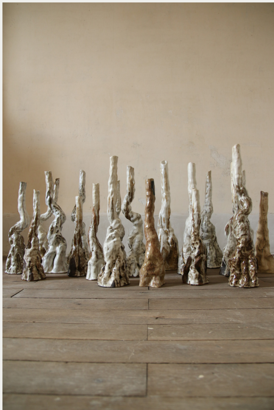
6. CROISSANCE 2021 24 pièces, céramique, terre de grès, émaillage, dimensions variables