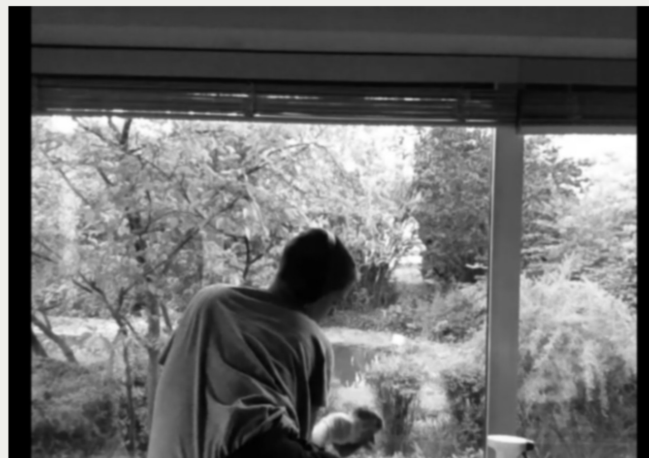
23. CLEANING VIDEO 1 (when you are a cleaning lady dreaming to be painter), 2018 Video (boucle) 4 min 12 autoportrait filmé avec un téléphone pendant les heures de travail