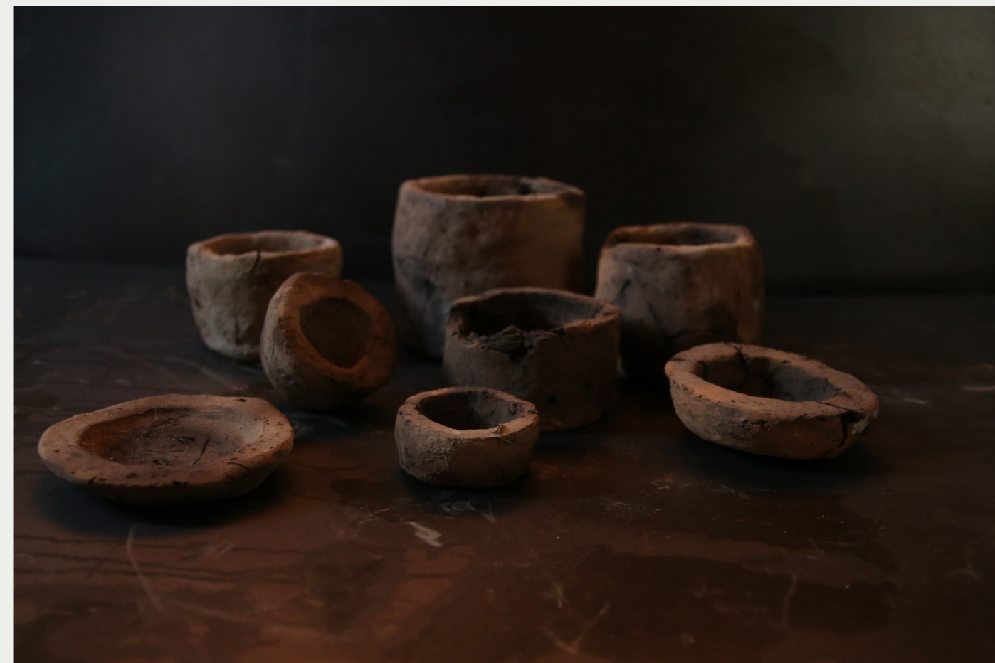
20. TERRACOTA 2016

terre argileuse extraite de la rivière qui passe sous la maison familiale, juste avant de quitter cet endroit pour toujours.