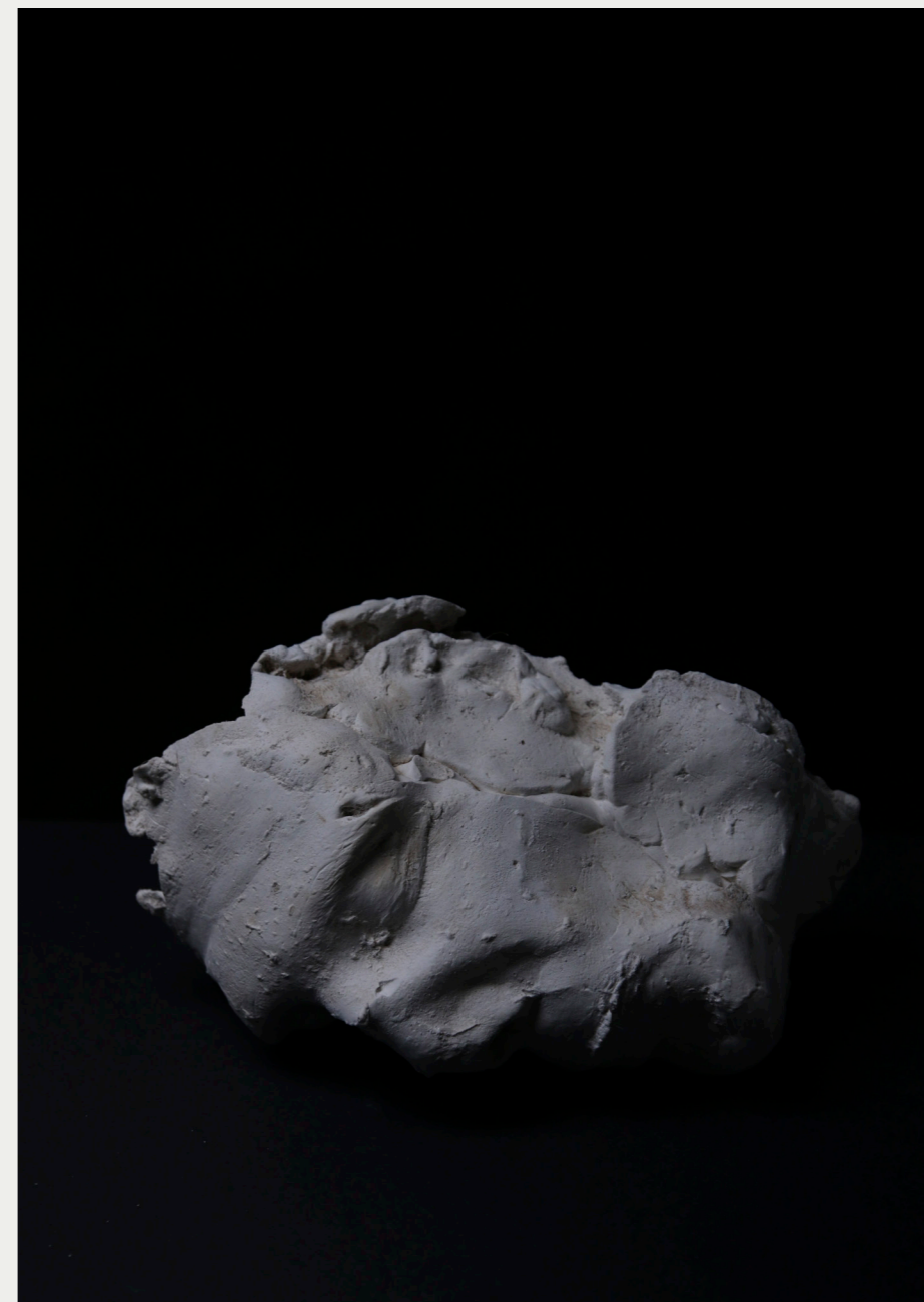
21. MASQUE OU DÉTERRER SON PROPRE VISAGE 2016 10 figures , moulage du visage avec la terre du lieu perdu, plâtre en coulée