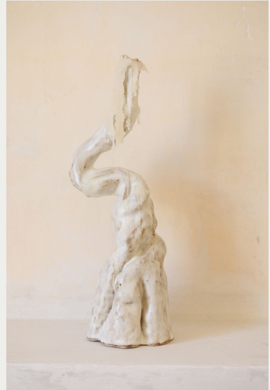
9. CROISSANCE 2021 céramique émailage KUDO MATO, cire de bougie