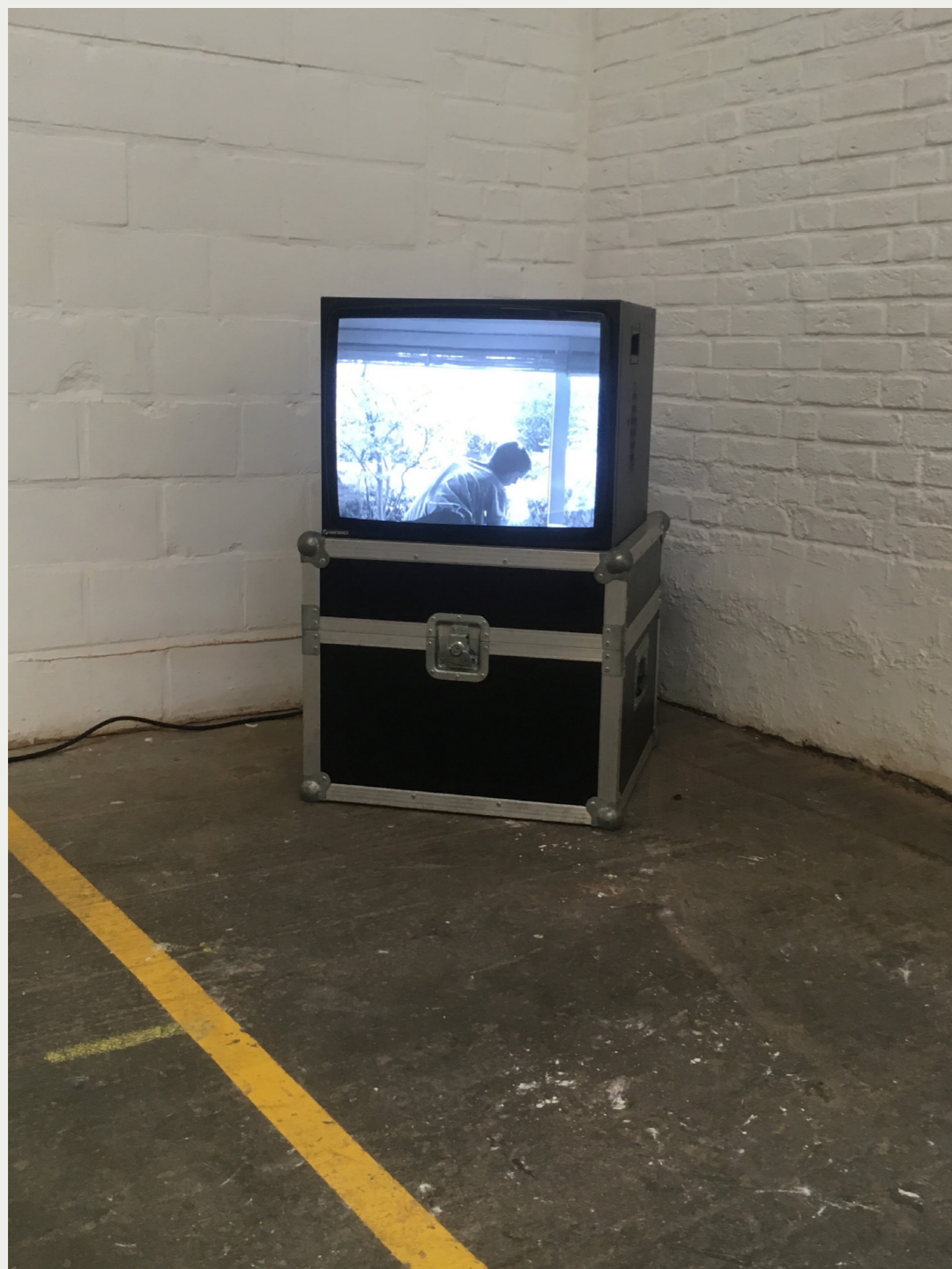
22. CLEANING VIDEO 1 (installation) 2018 MAINTENANCE exposition à In De Ruimte Curation Adrienne Van Der Werf Manifesto for maintenance Mierle Lademan Ukeles