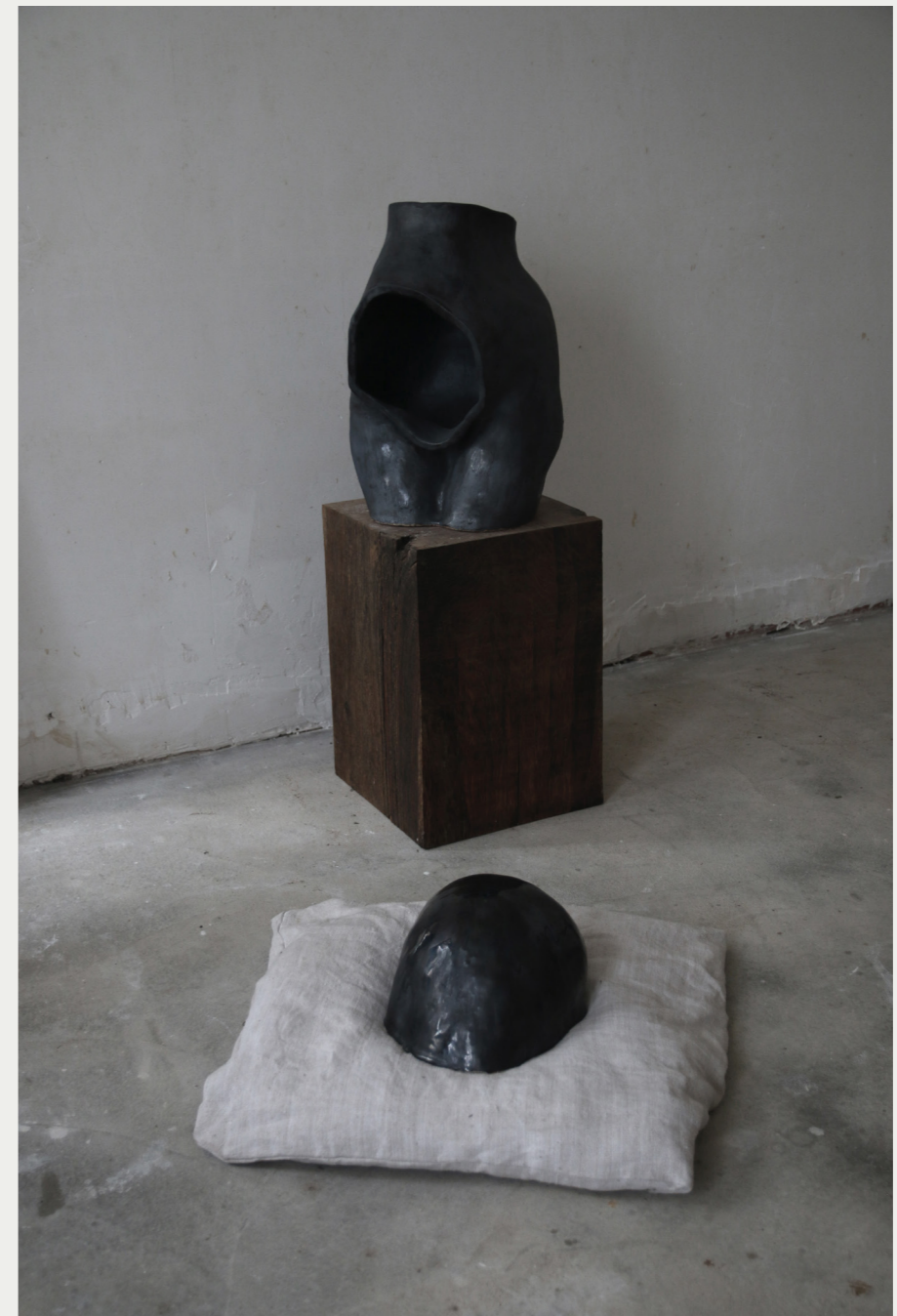
10. POST-PARTUM 2022

Buste et Dôme, céramique émaillée, grès, oxydes en saturation, émaillage à la cendre