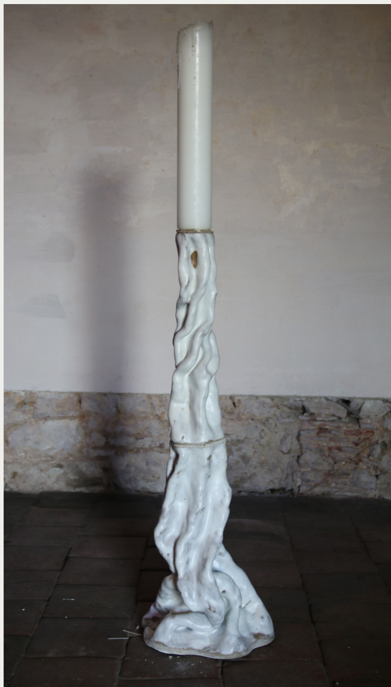
11. CROISSANCE 2023 bougeoir monumental, céramique émaillé, axe en acier, cierge 102 x 24cm