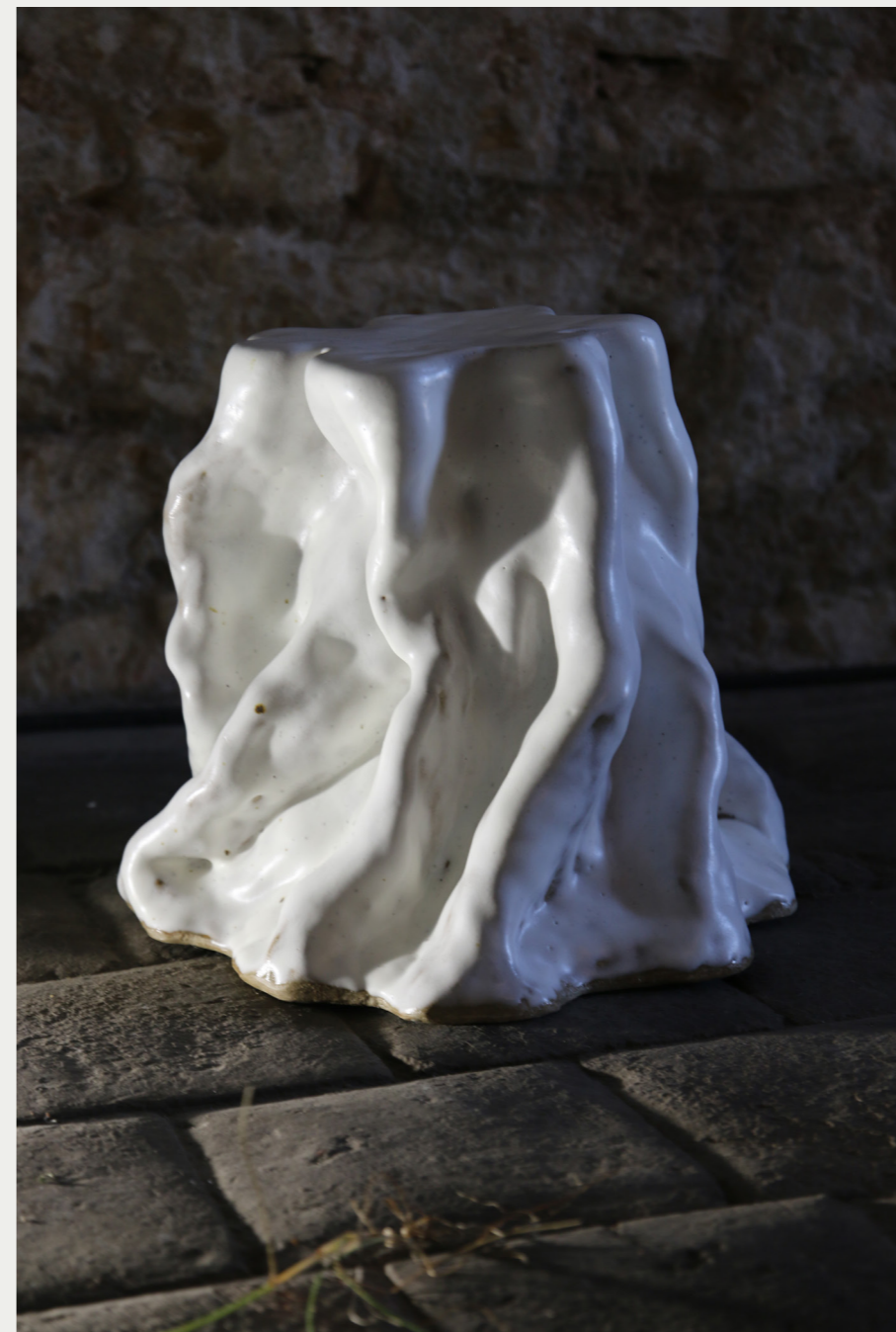
12. SOUCHE 2023 Céramique émaillé, KUDO MATO 29 x 30cm