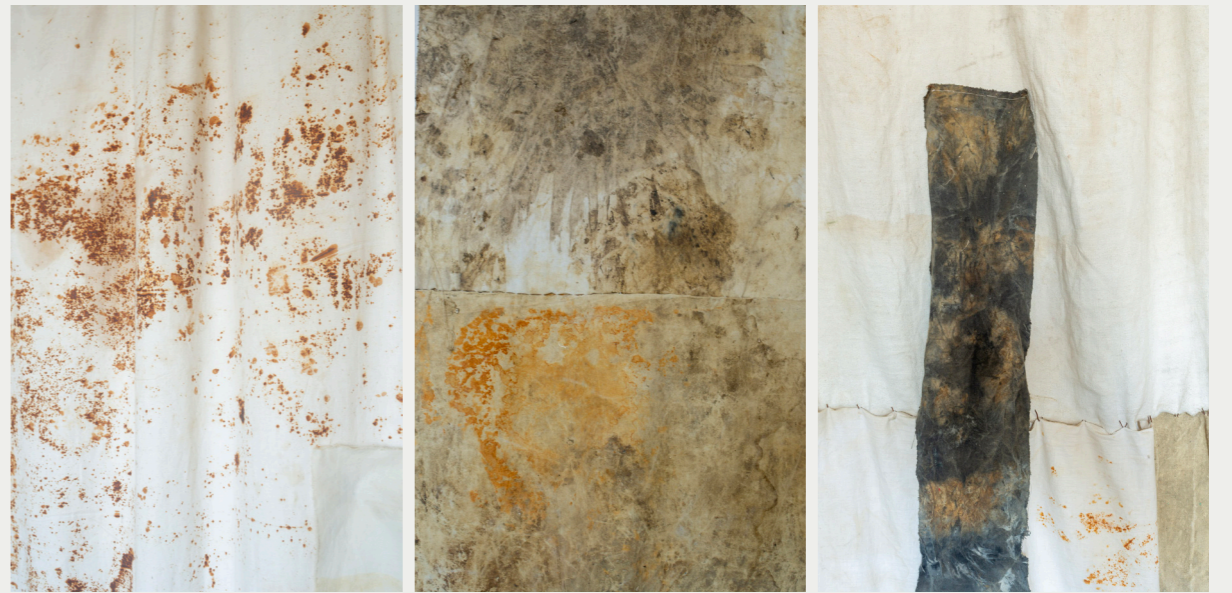
13. TENTURE | 2017

tissus d'atelier, lin et coton, pigments, curcuma, rouille, terre, bambou, ficelle