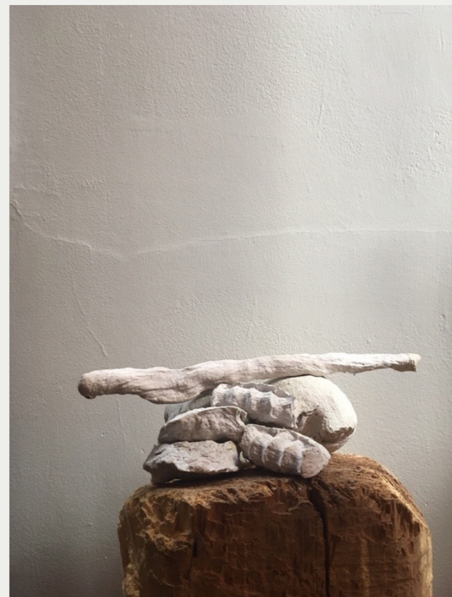
19. FRAGMENT 2001 - 2018

(page) journaux intimes de 2001 à 2018 désagrégés, détrempés en pâte à papier, marouflage papier japon, colle amidon, plaque d'acier, rouille, ficelle 118 x 84 x 10 cm