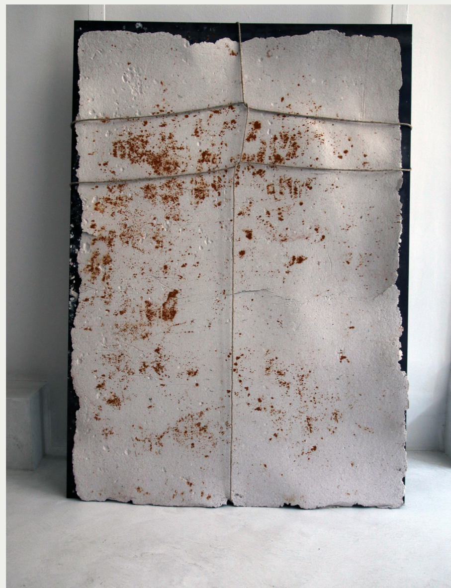
18. JOURNAL 2001 - 2018

(page) journaux intimes de 2001 à 2018 désagrégés, détrempés en pâte à papier, marouflage papier japon, colle amidon, plaque d'acier, rouille, ficelle 118 x 84 x 10 cm