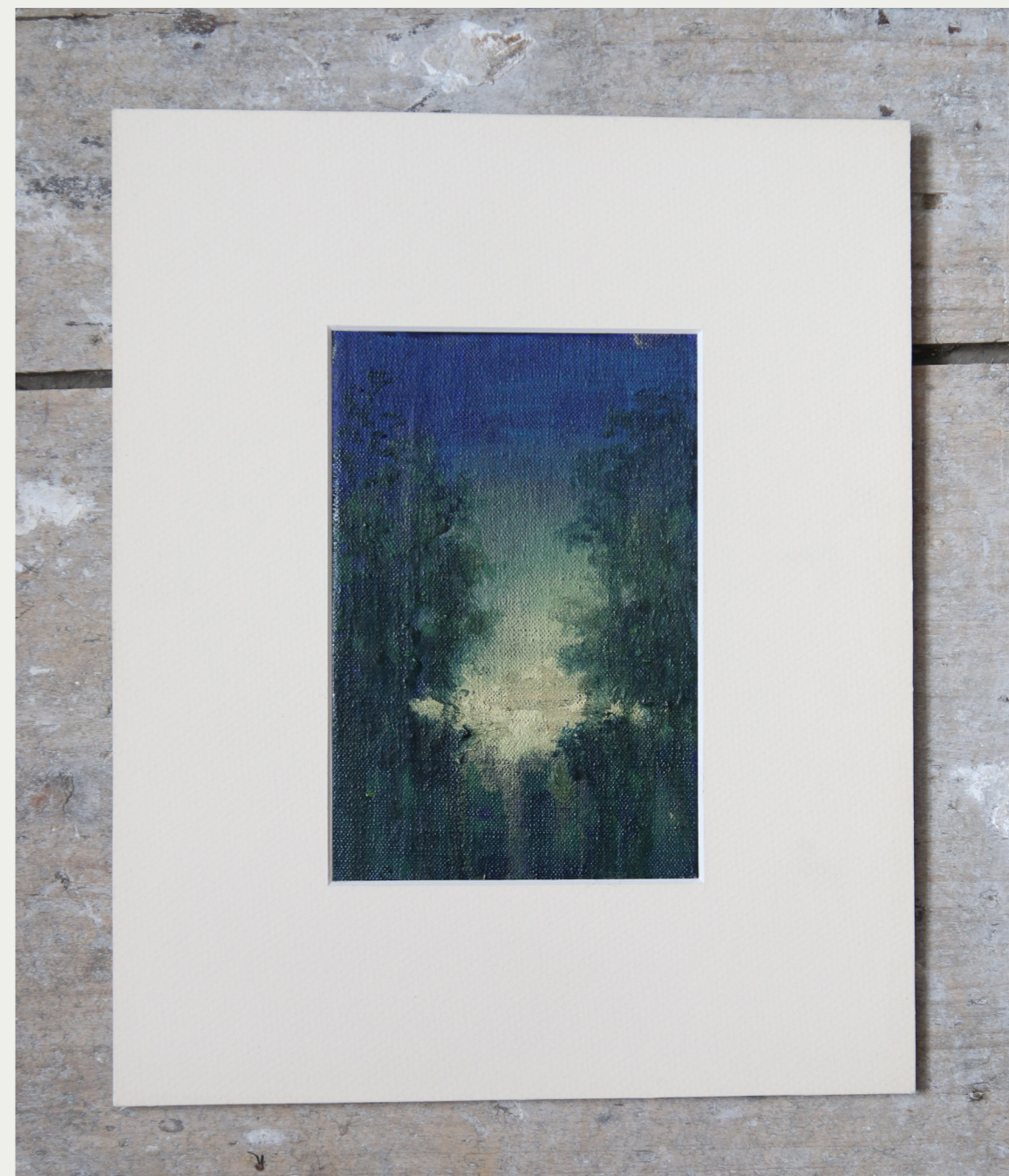
5. PAYSAGE VERT 2024 peinture à l'huile sur carton entoilé 10 x 15 cm