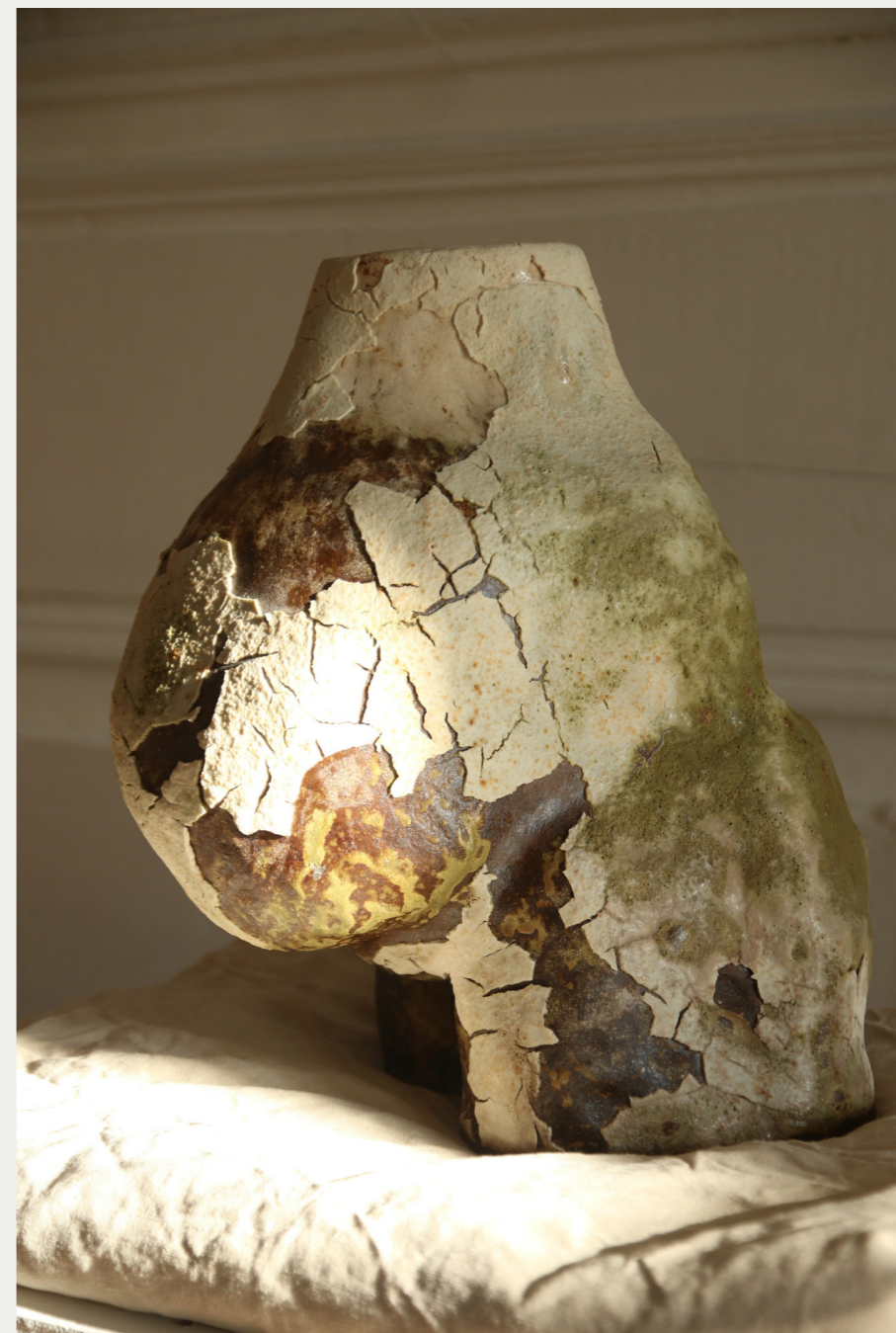
7. VENTRE 2021 céramique, grès, émaillage craquelé 46 x 40 x 32 cm