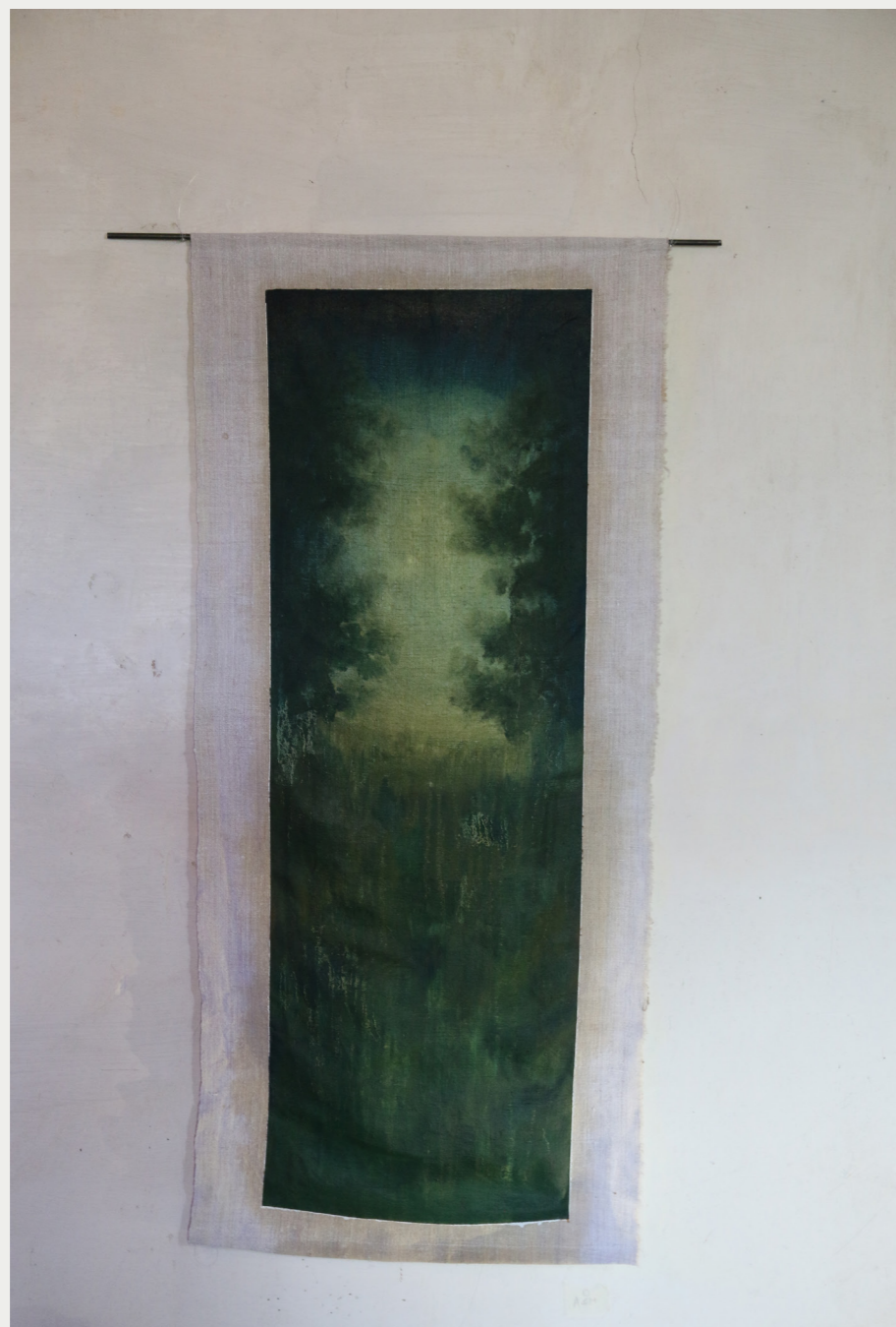
4. PAYSAGE VERT 2022 peinture à l'huile sur toile de lin, baguette en acier 104 x 64 cm