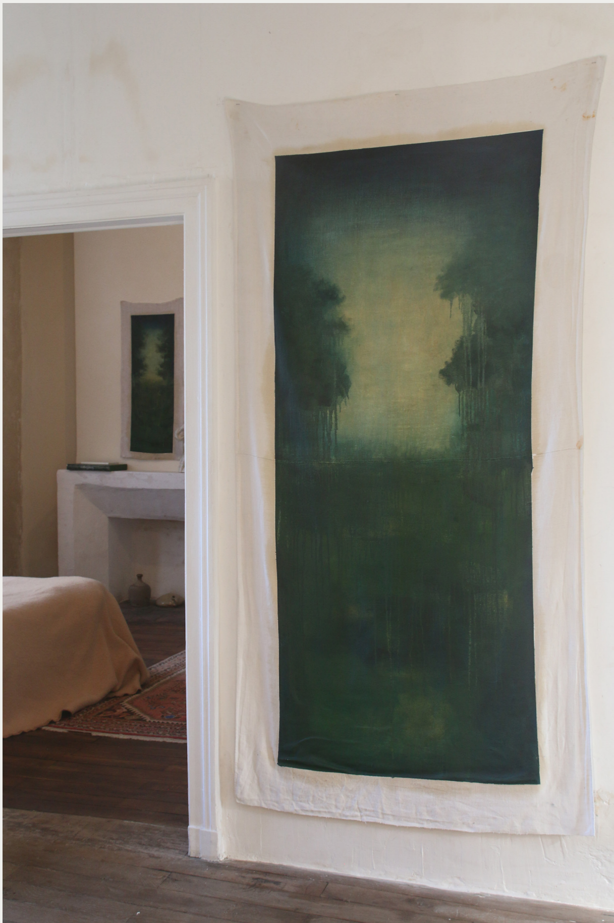
2. PAYSAGE VERT 2022 peinture à l'huile sur toile de lin, baguette en acier 205 x 128 cm